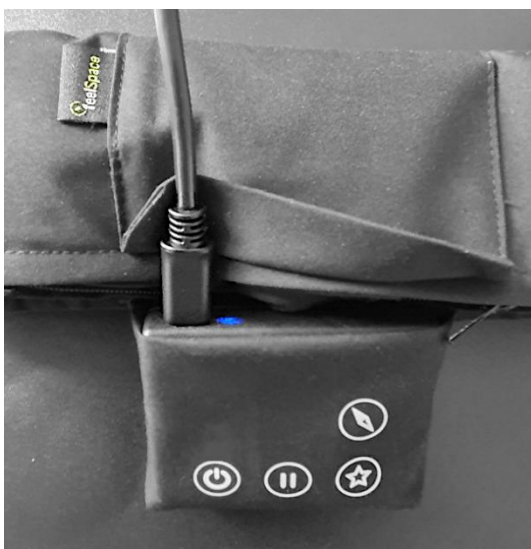
Abbildung 3: Aufladen des naviGürtel über USB-C

Laden Sie den naviGürtel vor der ersten Verwendung vollständig auf. Verwenden Sie hierzu das mitgelieferte Netzteil und Kabel. Beide Teile sind mit einer fühlbaren Erhebung, einer Gumminoppe, gekennzeichnet. Daran erkennen Sie, dass es zum naviGürtel gehört. Legen Sie den naviGürtel für den Ladeprozess ab, er soll zum Laden nicht am Körper getragen werden.