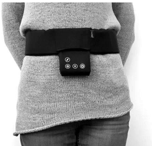
Abbildung 1: Richtiges Umlegen des naviGürtels

Laden Sie den naviGürtel vor der ersten Benutzung auf ( siehe Sektion „Aufladung“ ).